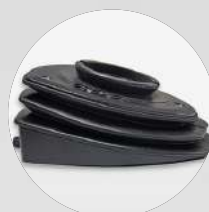
SUPPORTO REGOLABILE PER MICROSCOPIO (5°-25°)